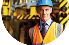
Technicien en hygiène et sécurité